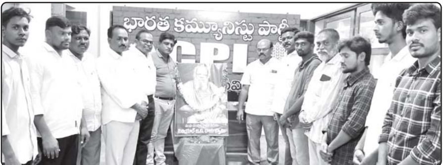
ది.17-09-2024 భారత కమ్యూనిస్టు పార్టీ కడపజిల్లా శాఖ ఆధ్వర్యంలో కడప హోచిమిన్ భవన్లో జరిగిన పెరియార్ 146వ జయంతి సభ దృశ్యం

నేనిలాగే మూఢనమ్మకాలను, మాయలను, అర్ధరహితమైన సంప్రదాయాలని విమర్శిస్తే చాలా మందికి అనుమానం వచ్చి నాకు దేవునిపై నమ్మకం ఉందా? అని అడుగుతారు. చాలామంది తమ స్వార్థానికి దేవుణ్ణి ఉపయోగించుకుంటారు. ఇలాంటి లావాదేవీ దేవునిపై నాకు నమ్మకం లేదు. దేవుడు ఉన్నాడని శాస్త్రీయంగా నిరూపించడం సాధ్యంకాదు. "దేవుడు, ఆత్మ మొదలైన వాటి గురించి చర్చించడం వ్యర్థం. అందువల్ల మంచిపని చేయి, మంచివాడివి కా - Do good and be good" అని బుద్ధుడు పదేపదే తన శిష్యులకు బోధించేవాడు. ఇది అత్యంత వ్యావహారికమైన Practical ఉపదేశం. దేవుడు లేకపోతే పోనీ మనుష్యుడు ఉన్నాడు కదా. అందువల్ల మన ధర్మానికి మనుష్యుడు కేంద్రబిందువు కావాలి. (ఆంధ్రజ్యోతి దినపత్రిక 28-01-2024 నుండి)