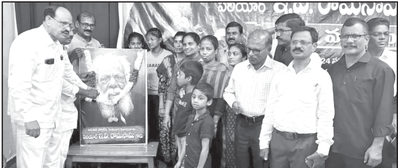
భారత నాస్తిక సమాజం (1995) ఆధ్వర్యంలో కరీంనగర్ ఫిలింభవన్లో ది.15-09-2024 ఆదివారం మధ్యాహ్నం 2 గం॥లకు జరిగిన పెరియార్ 146 వ జయంతి సభ దృశ్యం.