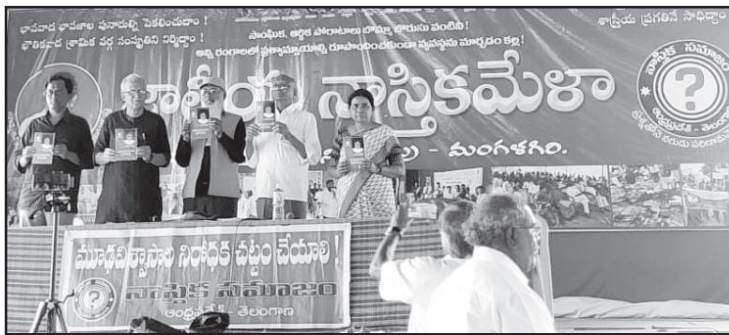
34వ జాతీయ నాస్తికమేళాలో 'మనిషితనం తప్ప ఏమీ తెలియని ఒట్టి చేతల మనిషి' పుస్తకావిష్కరణ దృశ్యం

భూమిమీద ప్రాణులు ఎలాంటి పరిణామాలకు లోనయాయి? దీనికి స్పష్టమైన సమాధానం లేదు. ఉన్నదల్లా శిలాజాల సాక్ష్యమే. ఉదాహరణకు మొప్పలున్న చేపల గురించి బోలెడు సమాచారముంది. అలాగే కాళ్ళున్న తొండలవంటి ఉభయచరాల గురించీ తెలిసింది. మరి బురద నీరు ఎండిపోవడంతో తప్పనిసరి అయి నేలమీద ఆడుగు పెట్టిన మొదటి కాళ్ళున్న చేప మాట ఏమిటి? అరుదైన దాని శిలాజం ఈ మధ్యనే దొరికిందట. ●