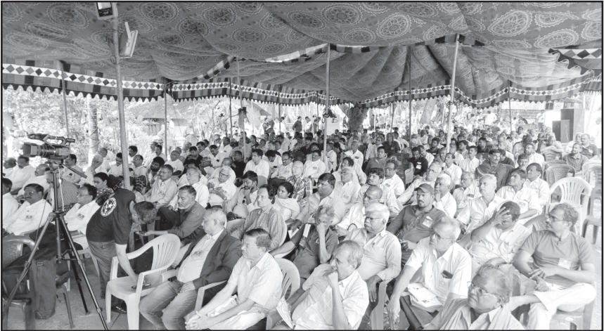
34వ జాతీయ నాస్తికమేళాలో హాజరైన ప్రతినిధులు

మతం ఎక్కడైనా, ఎప్పుడైనా, దోపిడికి ముసుగు వేసింది. సత్యం తెలుసుకోవాలంటే అంతరంగ పేటిక తెరిచి చూసుకోవాలి! అజ్ఞానం తొలగించుకోవాలి జ్ఞానమనే నిప్పును రగిలించుకోవాలి సత్యాన్ని సత్యంగా చూడాలి ఎవరో చెప్పినారని ఎక్కడో రాశారని నమ్మరాదు ప్రతిదాన్ని పరీక్షించు చూడు ఆచరణలో తేల్చిన సత్యం అదే జ్ఞానం అదే నీ చుట్టూ పన్నిన వలను దహించే సాధనం